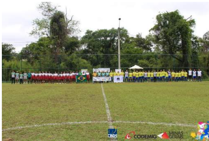
Foto - Equipe e Arbitragem posicionadas para início do jogo

O domingo amanheceu chuvoso em BH, mas todas e todos estavam ansiosos para o momento mais importante do evento: o jogo amistoso. A chuva deu trégua, com alguns espectadores surdos e ouvintes, assistindo presencialmente e mais pessoas assistindo via online, o jogo foi realizado.