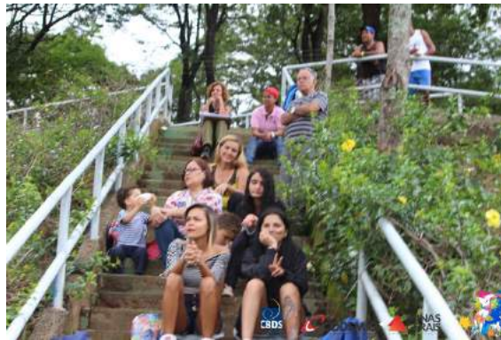
Fotos - Público assistindo ao jogo