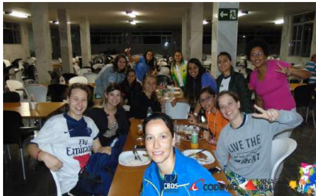
Foto - Primeiras surdoatletas que chegaram ao local no restaurante para jantar e receber orientações 30/11/2016

No dia 30/11 as surdoatletas e membros da comissão técnica da CBDS começaram a chegar ao local, recebendo o material, as orientações sobre hospedagem e da programação do evento.