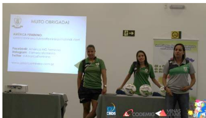
Foto - Palestra da Equipe do América Mineiro 03/12/16