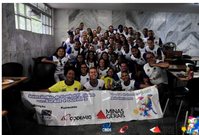
Foto - CBDS e América MG após o almoço e avaliação final do evento

Assim, o evento foi concluído com sucesso, atingindo seu objetivo graças a participação de todos.