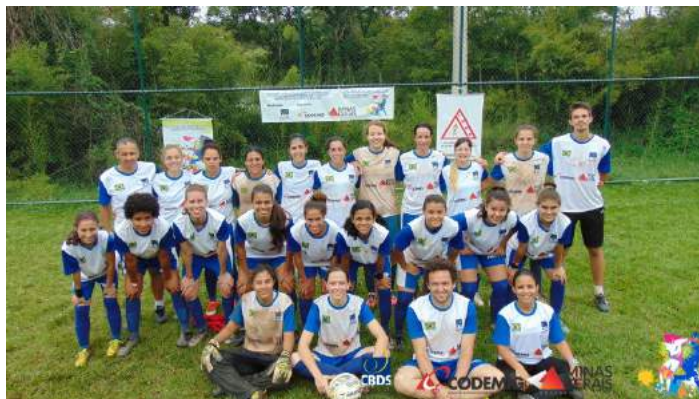
Foto - Equipe após treino do dia 01/12/16

No dia 01/12 iniciaram os treinos em campo sob chuva, com muita lama. Foi feita uma transmissão ao vivo no Facebook da CBDS mostrando o local e equipe treinando. E, foram publicadas fotos no Instagram e Facebook, sempre citando o patrocinador (vide relatório anexo).