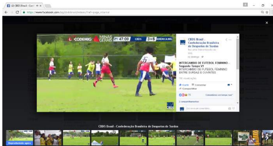
Figura - Imagem da tela de exibição do jogo no Facebook